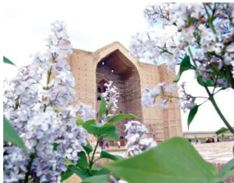
Кесене маңы гүл абат