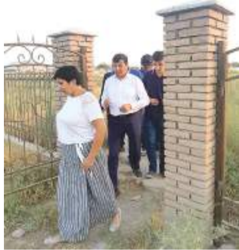
Дәлізі иірлі келген, мешіт құрылысы күйдірілген кірпішпен қаланып, күмбезбен көмкерілген. Төбенің орта денгейінен

Құмшық ата жерасты мешіті археологиялық ескерткіш саналады. Мешіт екі бөлмелі, ұзынша келген (10 м-ге жуық) ені тар дәлізді, шығарысында есігі бар үңгір. Шаршы шикі кірпіштерден қаланған. Түкпірдегі бөлме көлемі – 2х2 метрге жуық, биіктігі – 1,6 метр, төбесі шатырлы күмбезбен көмкерілген. Оған іргелес диаметрі – 2,5 метр және биіктігі – 2 метрдей дөңгелек пошымды үй күмбезделіп жабылған.