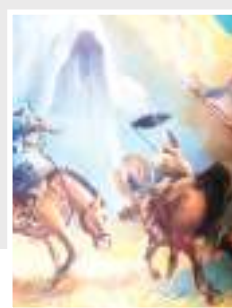
МҰХАММЕД ХАНАФИЯ – ИСЛАМ НҰРЫН ЖЕТКІЗУШІНІҢ БІРІ

Төлебилік асыл жанды аналар Қожа Ахмет Ясауи және кесенеді жерленген хан-сұлтан, батыр-билердің рухына құран бағыштап, қорық-музей жәдігерлерімен танысты.