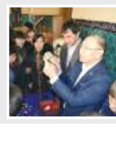
«ЗЕРГЕРДІҢ ҚОЛЫ АЛТЫН» КӨРМЕСІ